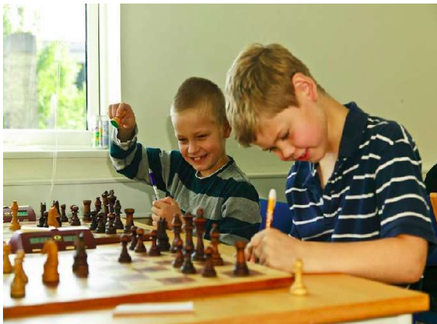
Se flere billeder i vores Facebook-gruppe.